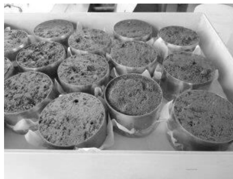
... zur Ermittlung physikalischer Bodenparameter