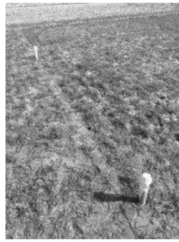
FDR-Röhren zur Ermittlung des Bodenwassergehaltes