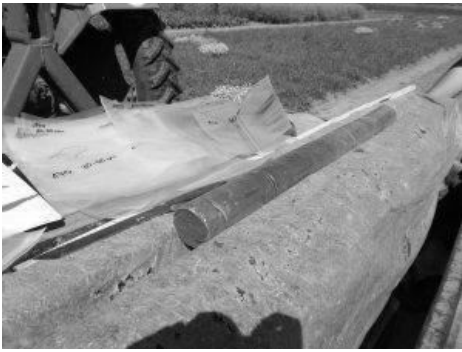
Destruktive Wurzelprobenahme mittels Schlauchkern.